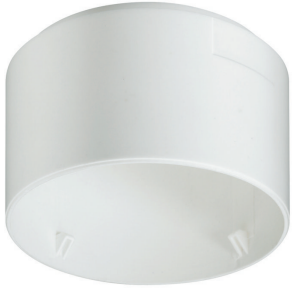
LRH2070/00 SURFACE BOX