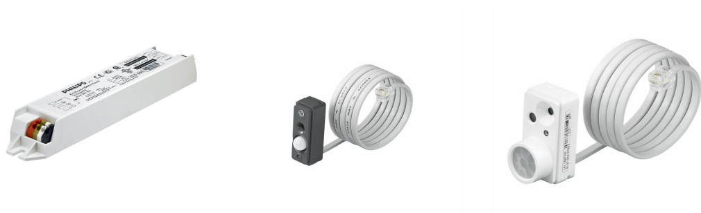
LR11663/00 ActiLume gen2 Multi-Sensor